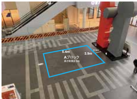
Aブロック使用可能範囲