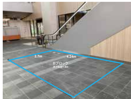
Bブロック使用可能範囲