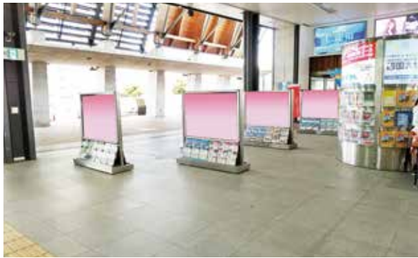
①ポスターサイン両面(8面)