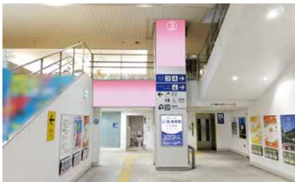
③階段左右柱 ④階段左右壁