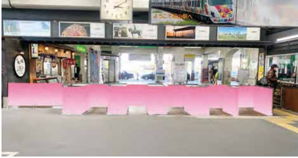
①改札ボックス(ホーム側)