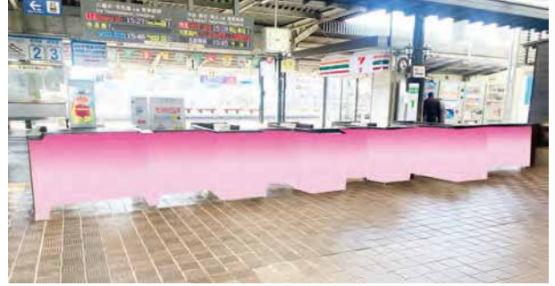
②改札ボックス(コンコース側)