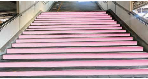
③ホーム階段ステップ面