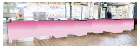
②改札ボックス(コンコース側)