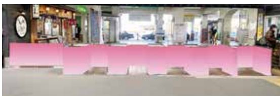
①改札ボックス(ホーム側)