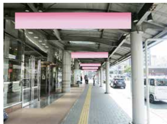
④自由通路バナー (両面 7本)