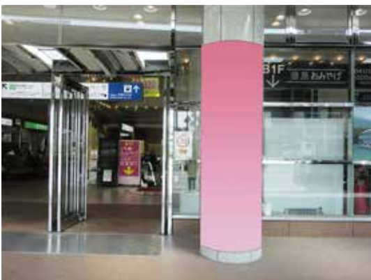
③駅舎入口外柱巻き (直径0.8m)