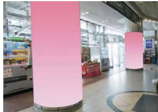
②コンコース内柱巻き (直径1.3m2本)