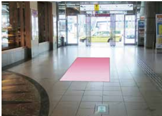
①コンコースフロア (2m×4m)